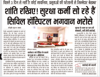
पिछले 3 दिन से नहीं है कोई जाचक, प्रहाराओं की परेशानी से किंगमेडर बेकरम शांति रखिए! सुरक्षा कर्मी सो रहे हैं सिविल हॉस्पिटल भगवान भरोसे

सुरक्षा कर्मियों के सोते हुए फोटो प्रकाशित होने के बाद सिविल हॉस्पिटल ब्यावरा का प्रबंधन जागा और कार्य में लापरवाही करने पर चेतावनी पत्र जारी करते हुए हॉस्पिटल अधीक्षक ने कहा है कि चिकित्सालय परिसर के पशुओं का विचरण आम बात है तथा वाहनों की पार्किंग भी ठीक ढंग से नहीं कराई जाने से अव्यवस्था बनी रहती है। साथ ही रात्रीकालीन सेवाओं में आप सोते हुए जाएं के फोटो समाचार पत्र में प्रकाशित हुए जिसके कारण विभाग की छवि धूमिल हुई है। आपका काम व्यवस्थाओं को बनाए रखना है परंतु आपके द्वारा सेवा शर्तों का उल्लंघन किया जा रहा है। हॉस्पिटल अधीक्षक ने निर्देश जारी करते हुए कहा कि इसकी