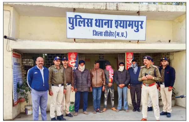
श्यामपुर। पुलिस की गिरफ्त में फरार आरोपी।